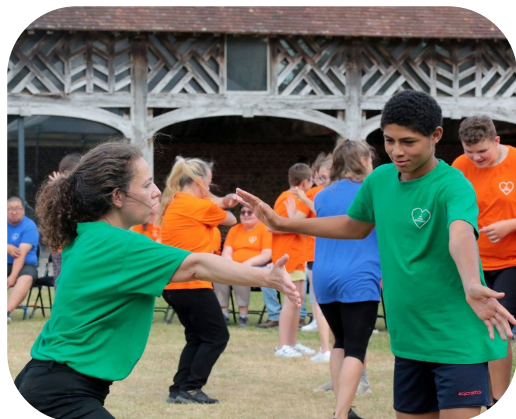
@CD80 - C.BAZIN