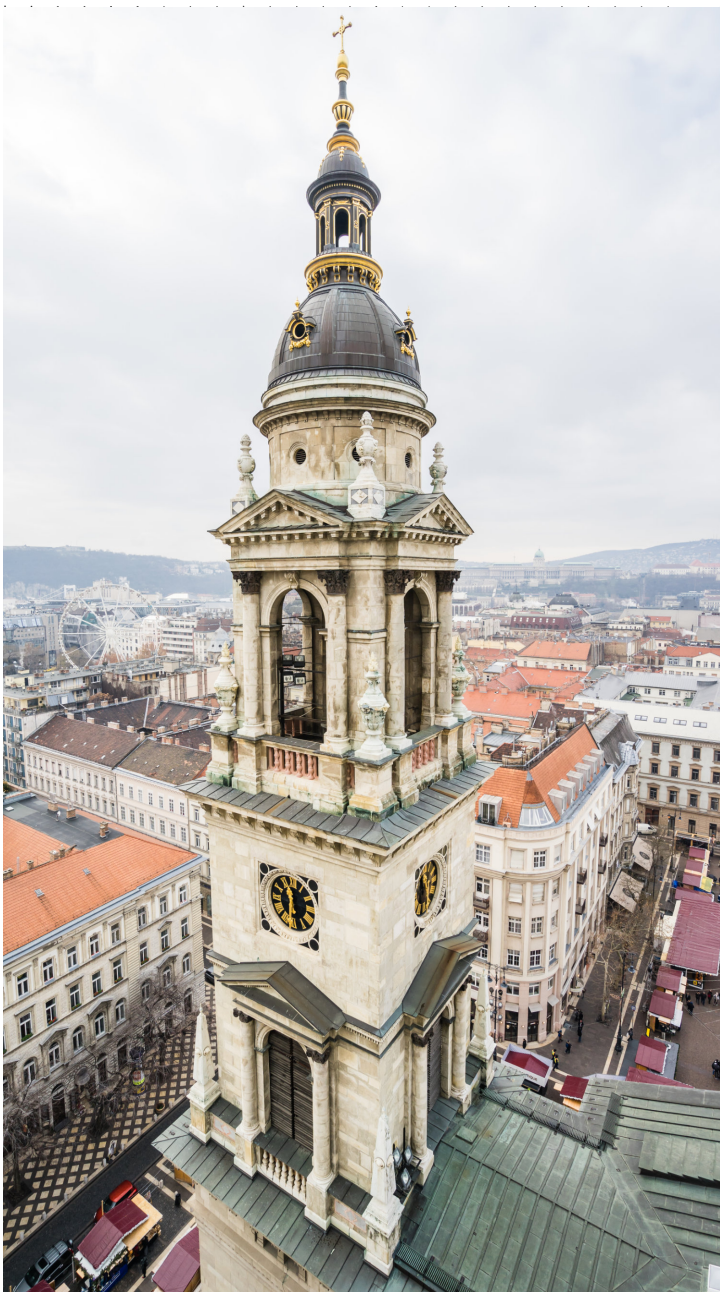
Vue aérienne verticale d'une tour de la basilique Saint-Étienne de Budapest, capitale de la Hongrie

La musique hongroise du 20ème siècle, notamment représentée par des compositeurs tels que Béla Bartók et György Ligeti, est caractérisée par son originalité, sa richesse et son exploration audacieuse des traditions musicales folkloriques et des techniques modernes.